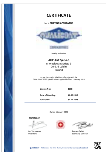
Certyfikat Qualicoat SEASIDE - aplikacja farb proszkowych